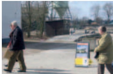
Op weg naar de volgende workshop

Met deze inspirerende woorden van de heer Tönissen verdeelden de honderd deelnemers zich over vijf verschillende workshopruimtes om het programma oriëntatie of verdieping te volgen. De thema's van de workshops varieerden van