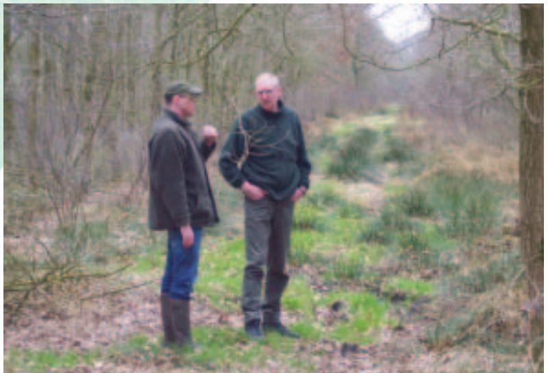
Vader en zoon Brinkhuis in één van de landschapselementen

RBC: Regionale Beheercommissie, in deze commissie van SBNL zijn de beherende WBE's door hun biotoopcoördinatoren vertegenwoordigd.