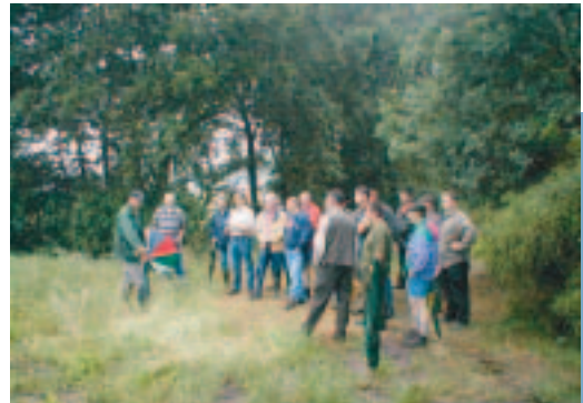
Verbreden van de draagvlak doe je onder andere door belangstellenden te laten zien wat het resultaat is van de ontplooiende activiteiten.

En continuïteit kun je controleren door meetpunten in te bouwen, die je van tevoren op papier hebt gezet. Om de betrokken WBE's te ondersteunen zijn er 66 inrichtingsplannen geschreven die, op een enkele na, allemaal zijn gerealiseerd.