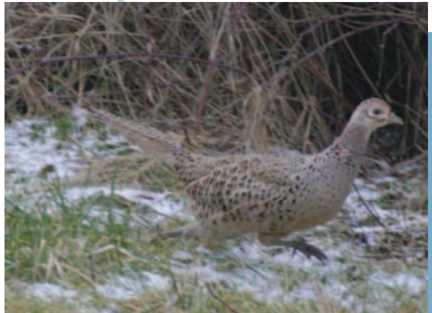
Niet vluchten voor allerlei planologische ontwikkelingen, maar bedreigingen omzetten in kansen ten voordele van het wild.

Door 69 WBE's is er maar liefst 317 hectares aan houtsingels extra in onderhoud genomen. Verder zijn er 118 hectares aan nieuwe akkerlanden en fauna-akkers aangelegd. Als we praten over randen van plusminus drie meter breed dan betekent dit een respectabele lengte van ruim 400 km! En al deze