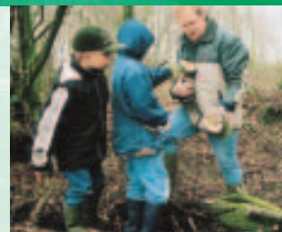
Jong geleerd, oud gedaan