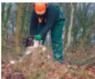
Motorzaag in werking