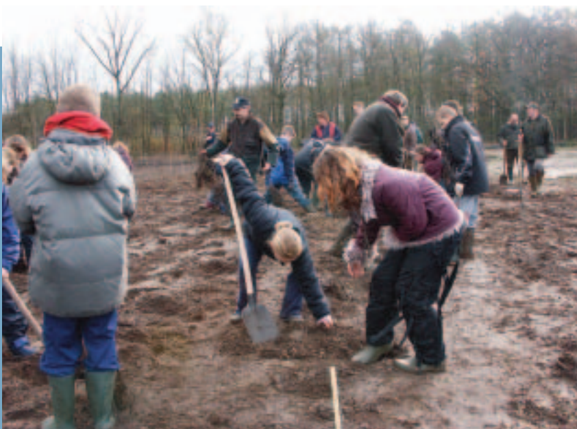
De toekomstige generatie vroegtijdig betrekken bij de activiteiten van de WBE.

Want wie de jeugd heeft, heeft de toekomst.