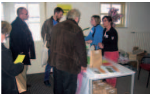
100 belangstellenden bezochten de kennisdag in Soerendonk

TEKST: DAGMAR MATTHIJSEN